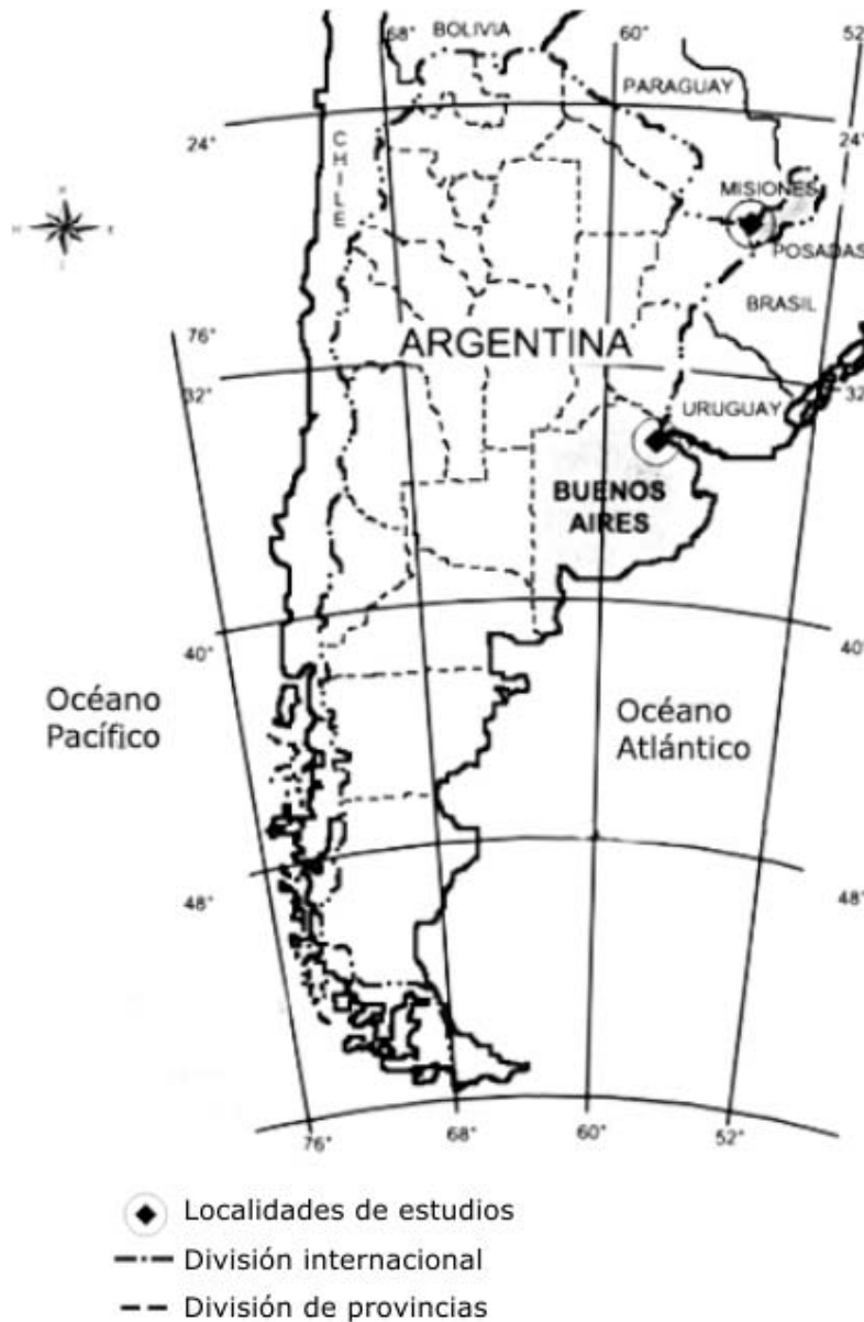
Fig.1. Provincias de la República Argentina donde fueron colectadas las cepas de A. aegypti . Provincia Misiones (Posadas) y provincia Buenos Aires (Buenos Aires).