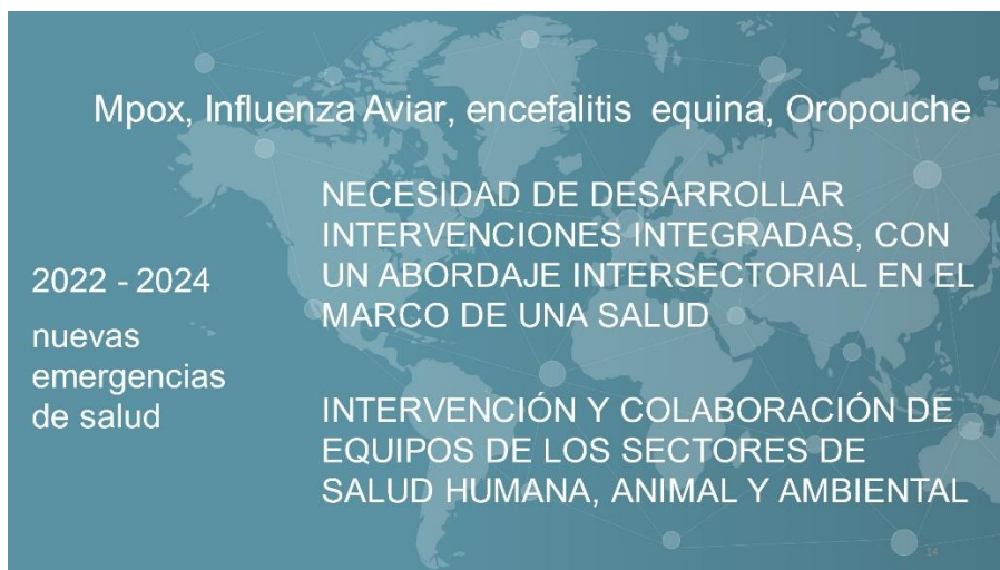
Fig. 2 – Emergencias sanitarias en el período 2022-2024.

Esa realidad evidencia la urgente necesidad de desarrollar intervenciones integradas, con un abordaje intersectorial en el marco de “Una Salud” y el incuestionable aporte, intervención y colaboración de equipos de los sectores de la salud humana, animal y ambiental, que inevitablemente tienen que estar liderados por la voluntad política de los gobiernos de cada país.