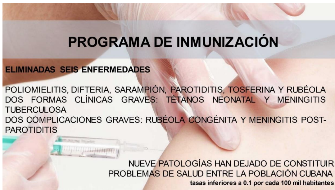
Fig. 5 – Programa de inmunización en Cuba.

Igualmente, la mortalidad por enfermedades infecciosas en Cuba es de apenas el 0,9 % del total de defunciones, en tanto la prevalencia del VIH/sida en las edades entre 15 a 49 años es de 0,13 por cada mil habitantes y se garantiza el tratamiento antirretroviral a todos los que lo necesitan. En lo referido a este último aspecto, comento a ustedes que en el 2015 fuimos reconocidos por la OMS/OPS como el primer país en el mundo en eliminar la transmisión materno-infantil del VIH/sida y la sífilis, condición que mantenemos en estos momentos. (10,18,19)