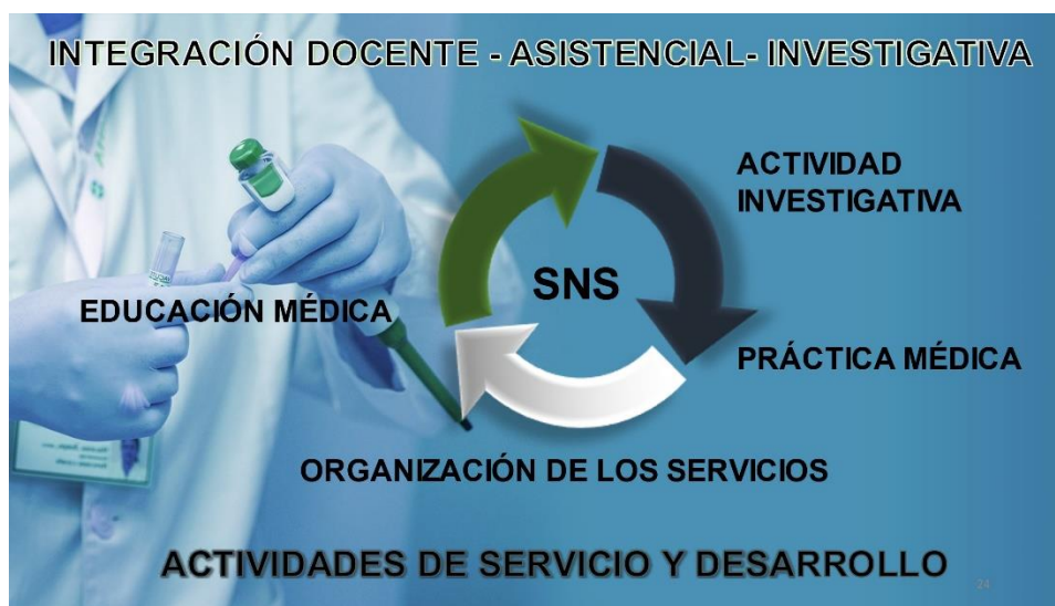
Fig. 4 – Integración docente-asistencial-investigativa del Sistema nacional de Salud.

En función de ese objetivo, adquiere especial relevancia la triada constituida por la integración docente-asistencial-investigativa. De tal manera, la articulación que se ha logrado entre la educación médica, la práctica médica, la organización de los servicios y la actividad investigativa, nos ha permitido contar, en un mismo espacio geográfico y de actuación, con las actividades de servicio y desarrollo que responden a las necesidades de salud de nuestra población (fig. 4).