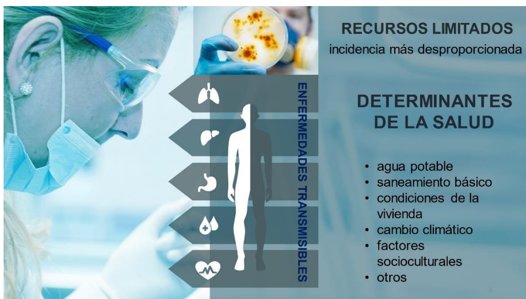
Fig. 1 – Determinantes de salud asociados con las enfermedades transmisibles.

Si bien ninguna nación está exenta de los peligros que entrañan las enfermedades transmisibles, sin dudas, es en las comunidades con recursos limitados donde tienen una incidencia más desproporcionada. Casi siempre, dichas enfermedades se vinculan con una compleja variedad de determinantes de la salud que se superponen, como son: la disponibilidad de agua potable, el saneamiento básico, las condiciones de la vivienda, el cambio climático, los factores socioculturales, entre otros (fig. 1). (1)